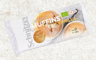
705975 Muffin vanille sans gluten BIO 2 x 70 gr