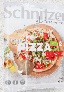
705980 Base pizza précuite sans gluten BIO 100 gr