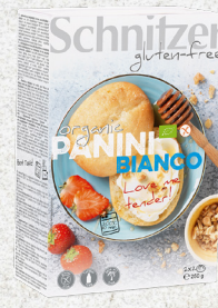
705982 Petit pain blanc sans gluten BIO 2 x 2 pc 250 gr