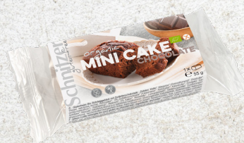
705977 Mini cake chocolat sans gluten BIO 12 x 55 gr