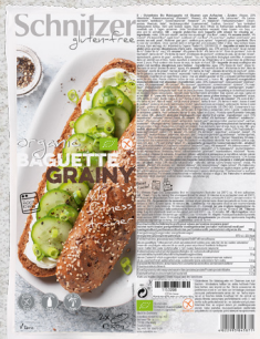
705973 Baguette graine sans gluten BIO 2 x 160 gr