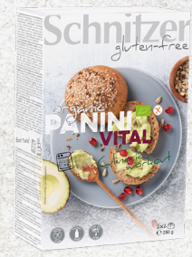
705981 Petit pain vital sans gluten BIO 2 x 2 pc 250 gr