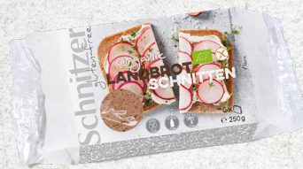
705971 Pain landbrot 6 tranches sans gluten BIO 250 g