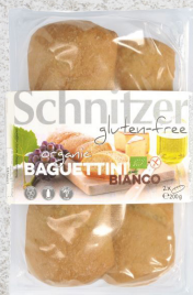
705970 Mini baguette sans gluten BIO 2 x 100 gr