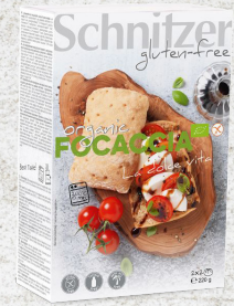
705972 Focaccia sans gluten BIO 2 x 2 pc 220 gr