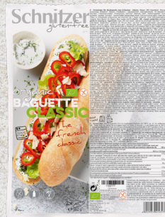
705974 Baguette sans gluten BIO 2 x 180 gr