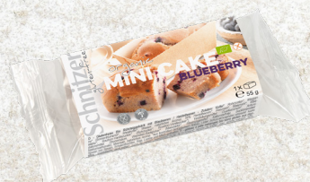
705978 Mini cake myrtilles sans gluten BIO 12 x 55 gr